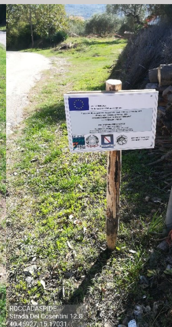
ROCCADASPIDE Strada Dei Cosentini 12.8 40.46927, 15.17031