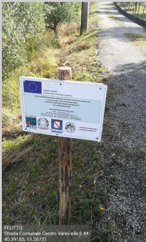
FELITTO Strada Comunale Cerrito Vanni elle 6.44 40.39185, 15.26731