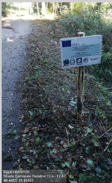
ROCCADASPIDE Strada Comunale Pedaline 12.6 - 12.47 40.4453, 15.14593