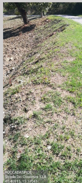
ROCCADASPIDE Strada Dei Cosentini 12.8 40.46915, 15.17041