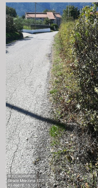
ROCCADASPIDE Strada Menzana 12.7 40.46678, 15.16777