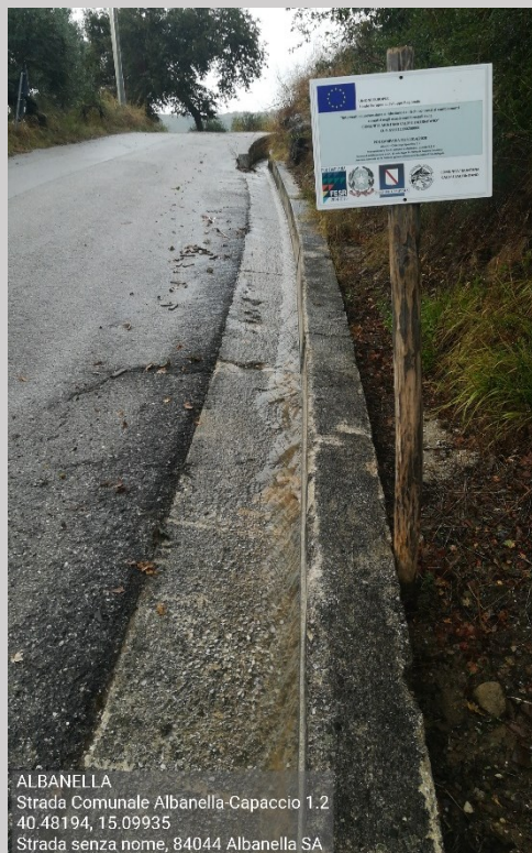
ALBANELLA Strada Comunale Albanella-Capaccio 1.2 40.48194, 15.09935 Strada senza nome, 84044 Albanella SA