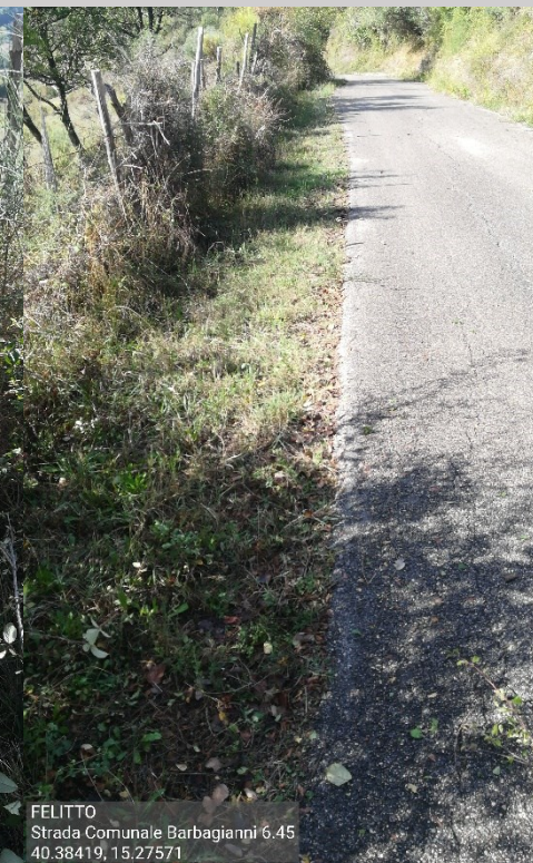
FELITTO Strada Comunale Barbagianni 6.45 40.38419, 15.27571