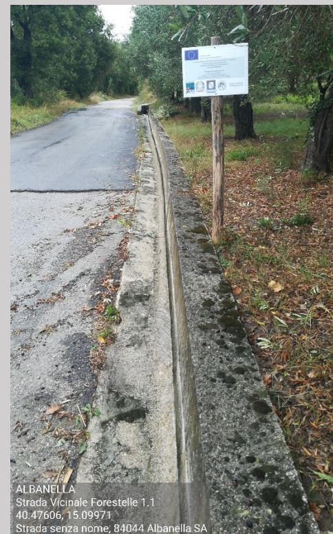
ALBANELLA Strada Vicinale Forestelle 1.1 40.47606, 15.09971 Strada senza nome, 84044 Albanella SA