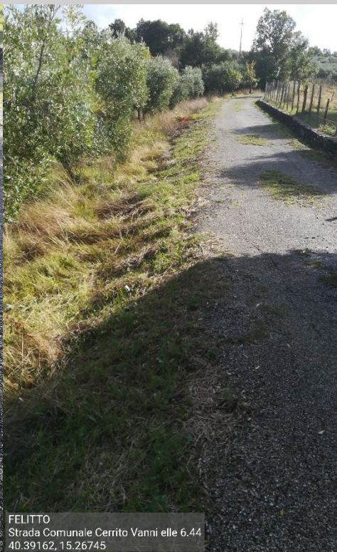
FELITTO Strada Comunale Cerrito Vanni elle 6.44 40.39162, 15.26745