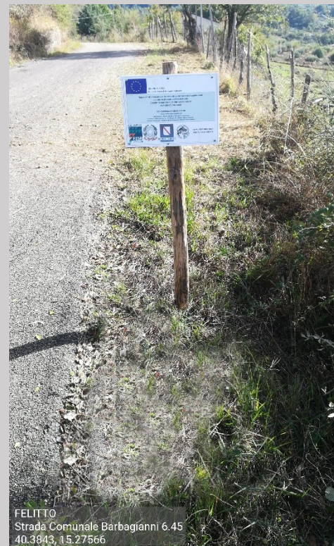
FELITTO Strada Comunale Barbagianni 6.45 40.3843, 15.27566