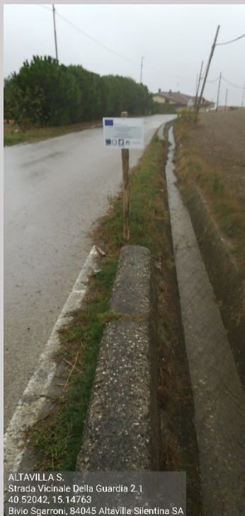
ALTAVILLA S. Strada Vicinale Della Guardia 2.1 40.52042, 15.14763 Bivio Sgarroni, 84045 Altavilla Silentina SA