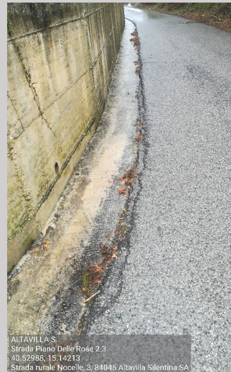
ALTAVILLA S. Strada Piano Delle Rose 2.3 40.52988, 15.14213 Strada rurale Nocelle, 3, 84045 Altavilla Silentina SA