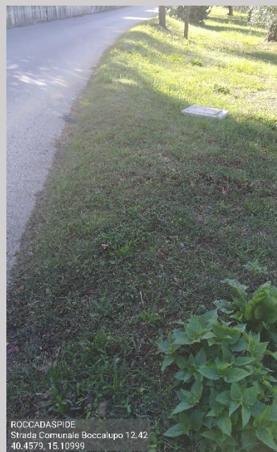
ROCCADASPIDE Strada Comunale Boccalupo 12.42 40.4579, 15.10999