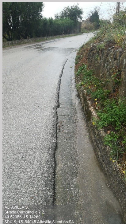
ALTAVILLA S. Strada Campinelle 2.2 40.52056, 15.14269 SP419, 15.84045 Altavilla Silentina SA