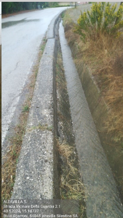
ALTAVILLA S. Strada Vicinale Della Guardia 2.1 40.52024, 15.14737 Bivio Sgarroni, 84045 Altavilla Silentina SA