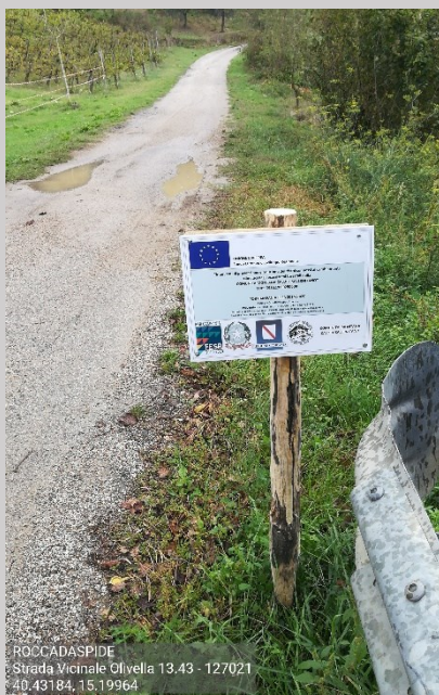
ROCCADASPIDE Strada Vicinale Olivella 13.43 - 127021 40.43184, 15.19964